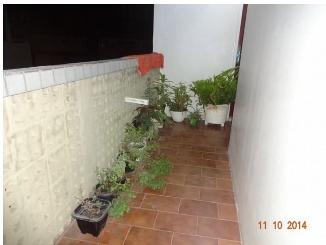
EVIDÊNCIA EM 11/10/2014