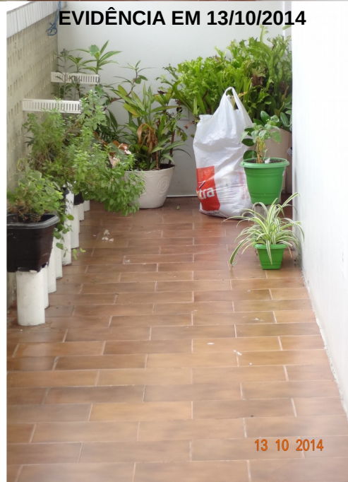
EVIDÊNCIA EM 13/10/2014