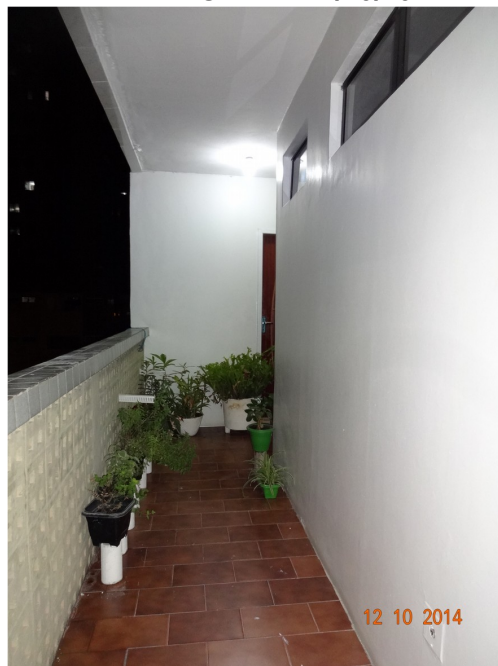
EVIDÊNCIA EM 12/10/2014