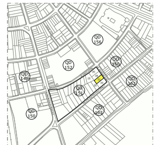
PLANTA DE SITUAÇÃO ESCALA 1:500